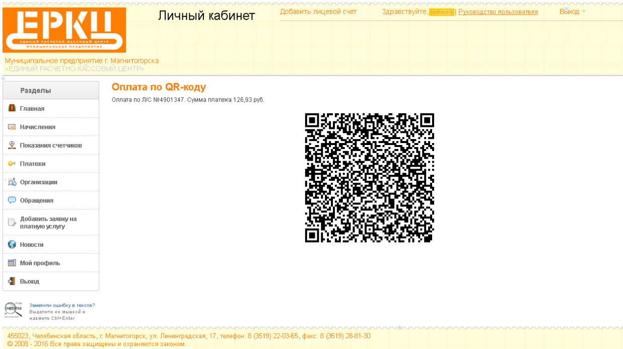
Рис.7 Оплата по QR-коду